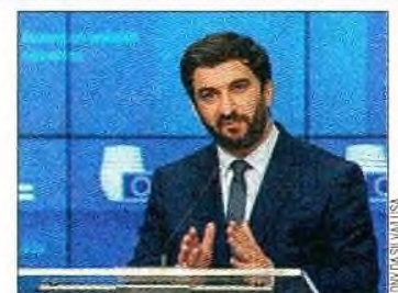
Ministro Tiago Brandão Rodrigues

e no atual os exames para melhoria de nota, no âmbito das regras para conter a pandemia. Só a 15 de abril deste ano o Parlamento aprovou (com votos contra do PS) projetos de PSD, CDS e PAN para reverter a medida. ●